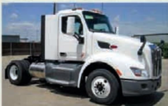
Avec son camion-concept, Peterbilt a donné un aperçu de ce que pourrait être le camion du futur.

Le camion-concept est également muni d'un système GPS pour ajouter des fonctionnalités comme le routage du dernier mille, l'aide au stationnement et la nouvelle fiche de compétence du conducteur.